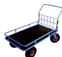
STACH IV R