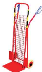
ALOŚ III S